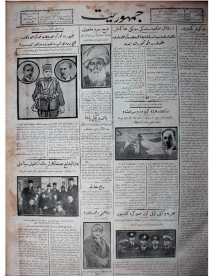
Şeyh Said İsyanı ile ilgili haberleri aktaran Cumhuriyet gazetesi

Yapılan plânlı bir askerî harekât sonrasında isyan tamamen bastırılmıştır. Şeyh Said ve Seyit Abdülkadir'in de dahil olduğu isyanın elebaşlıları, Takrir-i Sükun Kanunu ile kurulan İstiklâl Mahkemelerinde yargılanarak idama mahkûm olmuşlardır.