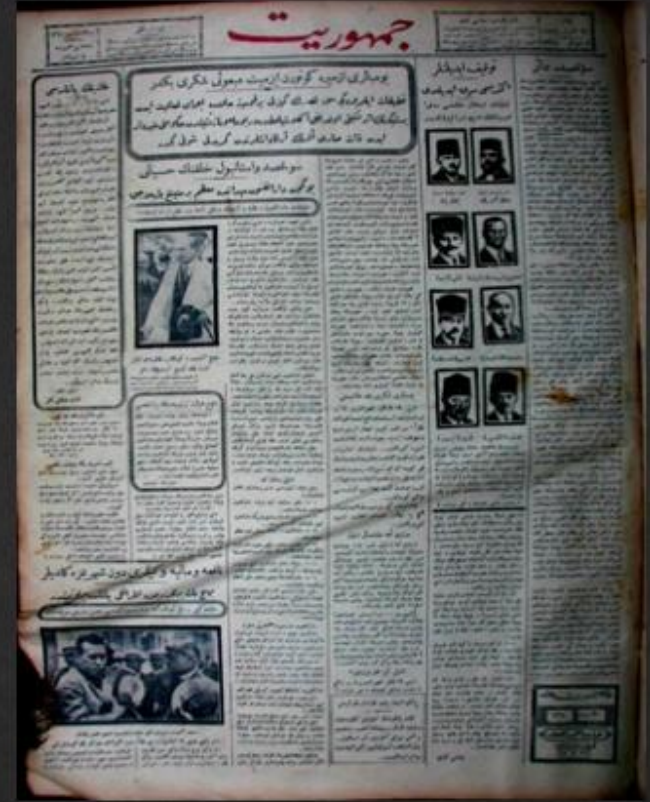
İzmir Suikastı ile ilgili haberlerin yer aldığı Cumhuriyet gazetesi

Bu olaydan sonra İzmir'e gelen İstiklâl Mahkemesi heyetince yapılan duruşmalarda 40 kişi yargılandı. İzmir'de kurulan istiklal Mahkemesi'nde yargılananlar arasında eski komutanlar, valiler ve İttihatçıların da bulunması, bu davanın siyasi bir dava olarak nitelenmesine neden olmuştu. Yapılan yargılamalar sonucunda 15 kişi idamla cezalandırıldı. Aynı davanın uzantısı olarak birkaç hafta sonra Ankara'da yapılan tutuklama ve gerçekleştirilen duruşmalarda yargılanan 57 kişiden ise dördü idam cezasına çarptırıldı. Toplam 97 kişinin yargılandığı davalar sonucunda 19 idam, 9 sürgün ve hapis cezası verilirken kalan 69 kişi de beraat etti.