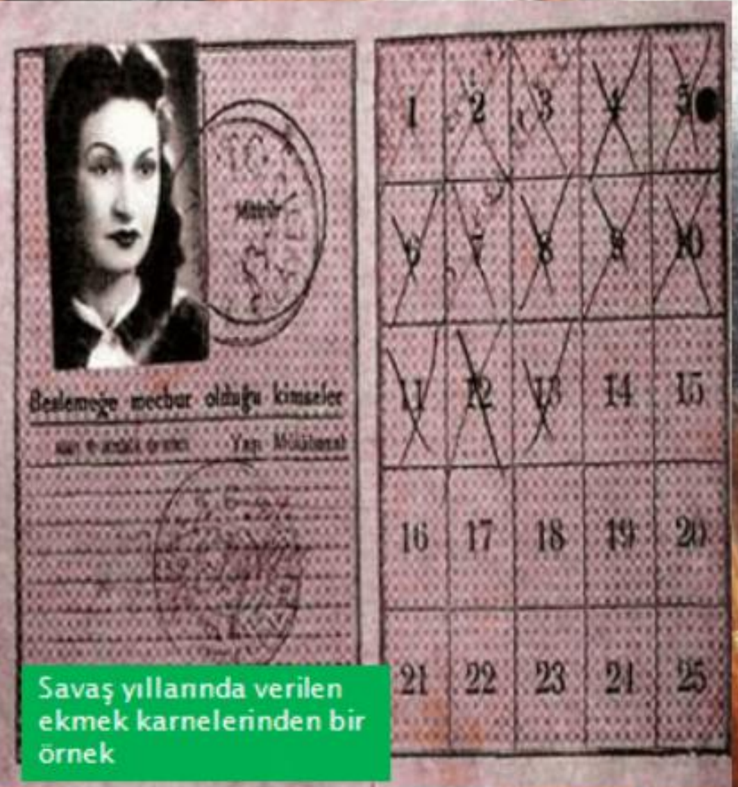
Savaş yıllarında verilen ekmeğin karnelerinden bir örnek