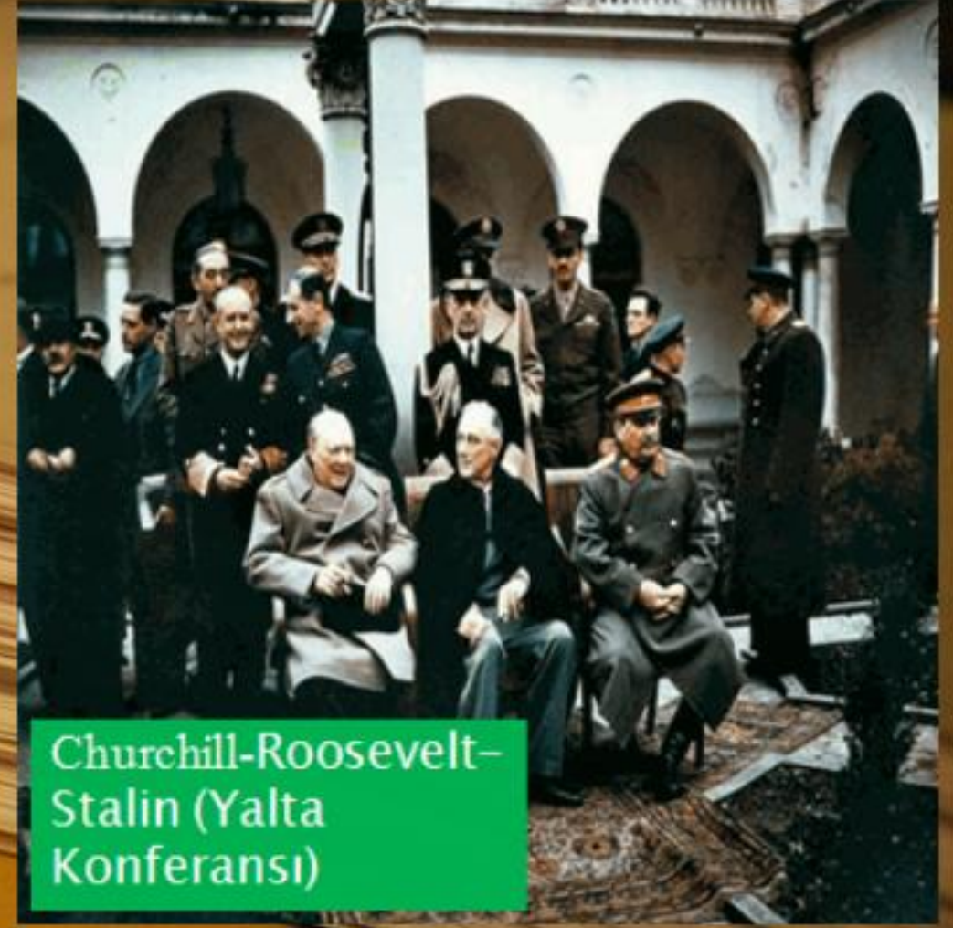
Churchill-Roosevelt- Stalin (Yalta Konferansı)

Yalta Konferansı'nda Sovyet Rusya'nın, 1936 Montreux Konferansı'nda belirlenen boğazlar rejiminin değişmesi konusundaki istekleri Türkiye'yi endişeye düşürmüştür. Türkiye, kendisini savaş sonrası bekleyen en büyük tehdidin Sovyetler olacağı yönündeki tahminlerinde haklı çıkmıştır.