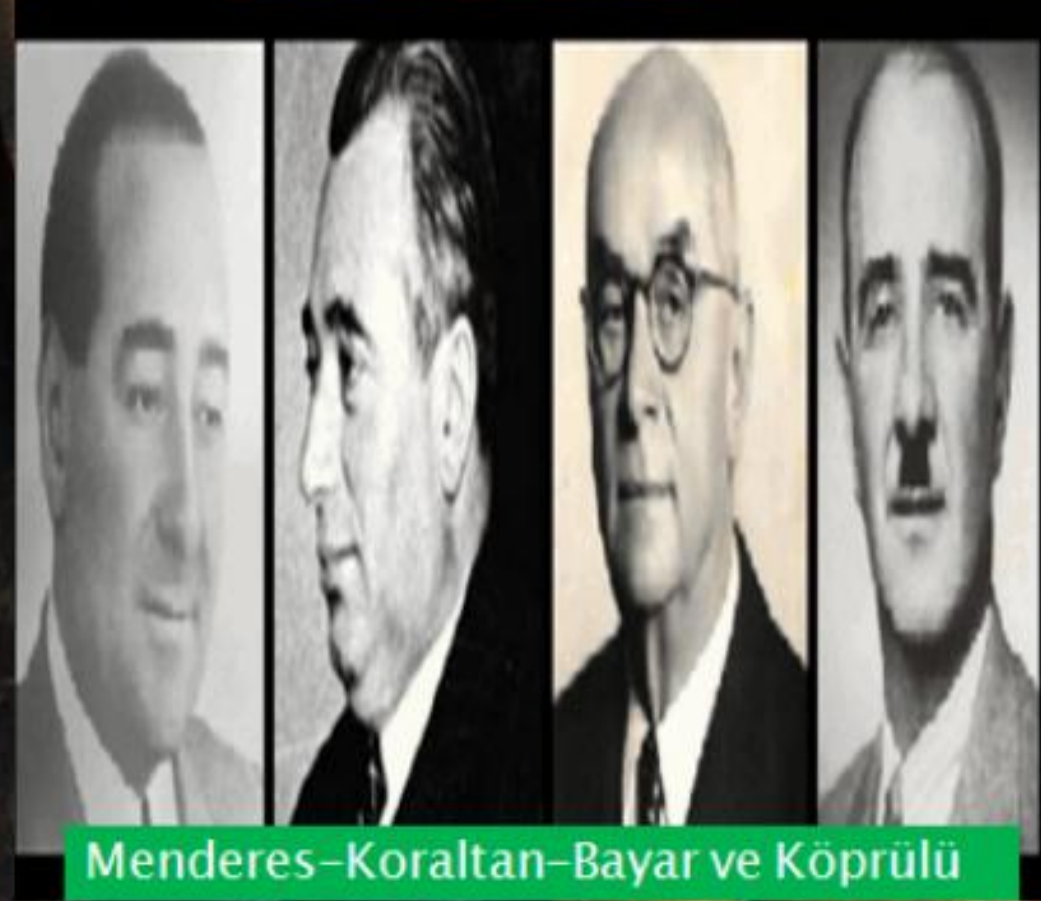
Menderes-Koraltan-Bayar ve Köprülü

Batı Dünyasının liderliğinde kurulan Birleşmiş Milletlere katılmak için ön şartları yerine getiren Türkiye de Batının çoğulcu demokratik sisteminin artık uygulamasının şart olduğu ortaya çıktı. Sonuçta Cumhurbaşkanı İsmet İnönü CHP içinde birçok muhalefete rağmen 1945'ten itibaren anayasaya uygun olarak birçok partinin kurulması için yasal süreci başlattı. Bu koşullarda 1945 yılı içinde CHP içindeki dört milletvekili CHP'nin uygulamalarına karşı ilk büyük girişimi başlattılar.