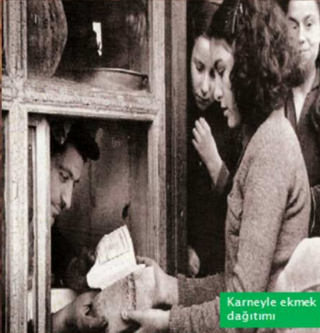
Karneyle ekmeğin dağıtımı