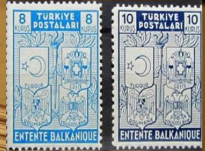
Balkan Pakti Hatırasına Basılan Pullar

Bu sürecin devamı olarak Yugoslavya, 27 Kasım 1933'de Türkiye ile Dostluk, Saldırmazlık, Hakemlik ve Uzlaştırma Antlaşması imzalamıştır.