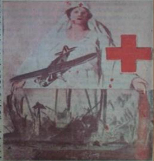
Altteki resim İtalyan uçaklarının geçenlerde Dessi'deki hastahaneyi bombardımanları esna - sında alınmıştır.

Bu büyük mu - harebe pazar gi - ni başlamıştır. Muharebeye gi - ren İtalyan kuv - vetleri, yerli İtal - yan askerleri ile tamamen mutörlü (Sona Sa. 7 Sa. 1)